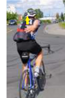
ICH stehe auf