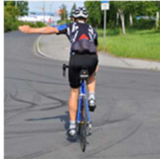
links od. rechts